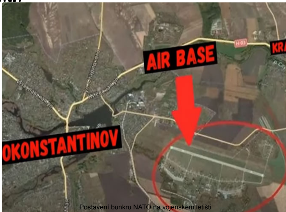
Postavení bunkru NATO na vojenském letišti

Ukázalo se, že ruská zpravodajská služba tento raketový útok pečlivě připravila. Ruské rozvědce se totiž podařilo najít a identifikovat téměř všechny způsoby zásobování ozbrojených sil Ukrajiny západními zbraňovými systémy. Ruské rozvědce se navíc podařilo určit přesné umístění všech tajných vojenských objektů NATO, včetně podzemních bunkerů v hloubce 20-30 metrů.