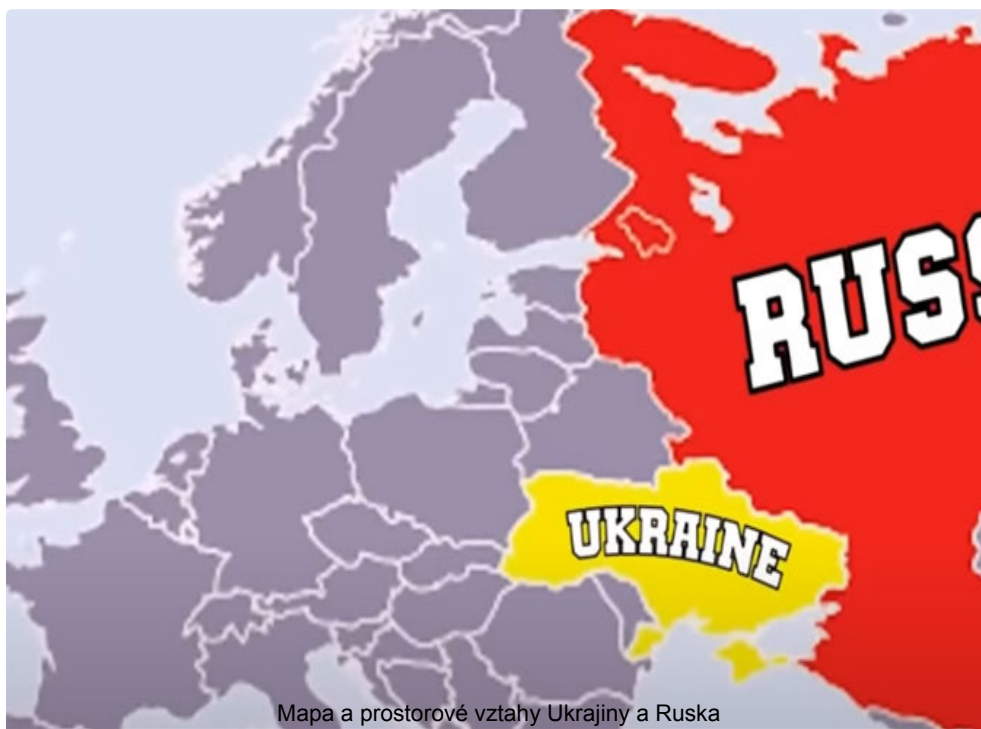
Mapa a prostorové vztahy Ukrajiny a Ruska

Ukázalo se, že ruská zpravodajská služba tento raketový útok pečlivě připravila. Ruské rozvědce se totiž podařilo najít a identifikovat téměř všechny způsoby zásobování ozbrojených sil Ukrajiny západními zbraňovými systémy. Ruské rozvědce se navíc podařilo určit přesné umístění všech tajných vojenských objektů NATO, včetně podzemních bunkerů v hloubce 20-30 metrů.