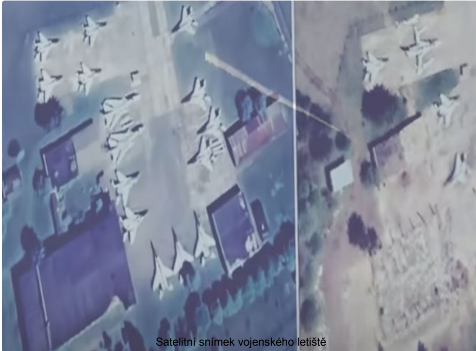
Satelitní snímek vojenského letiště

Přesně jedna velká a dlouhodobá operace ruské služby vyšla najevo krátce po jejím provedení s velkými důsledky pro země NATO, které se ji snažily utajit, protože kvůli studu a hněvu nemohly ani okamžitě reagovat, takže reakce byly impulzivní. a podle mnoha zdrojů zcela bez efektu a předpovídaly ještě větší (naštěstí) pouze materiální škody Ozbrojeným silám Ukrajiny a alianci NATO.